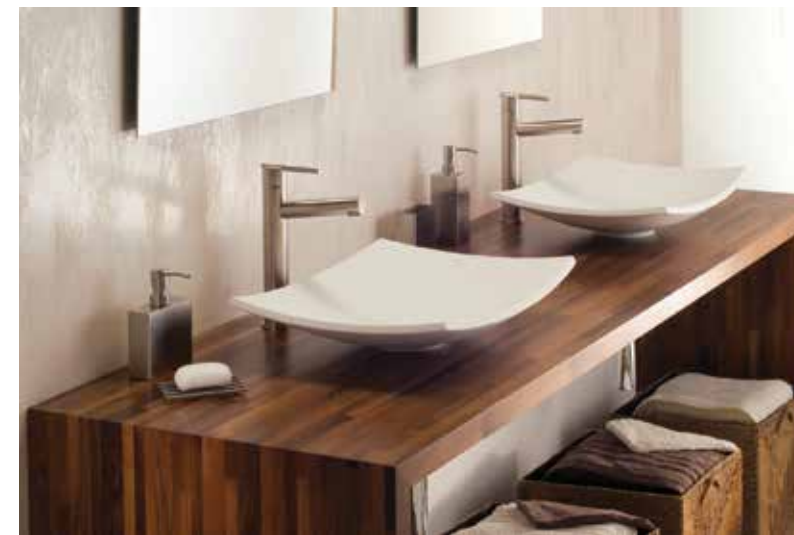
Meuble de salle de bain en panneau Patchwood® — Essence noyer