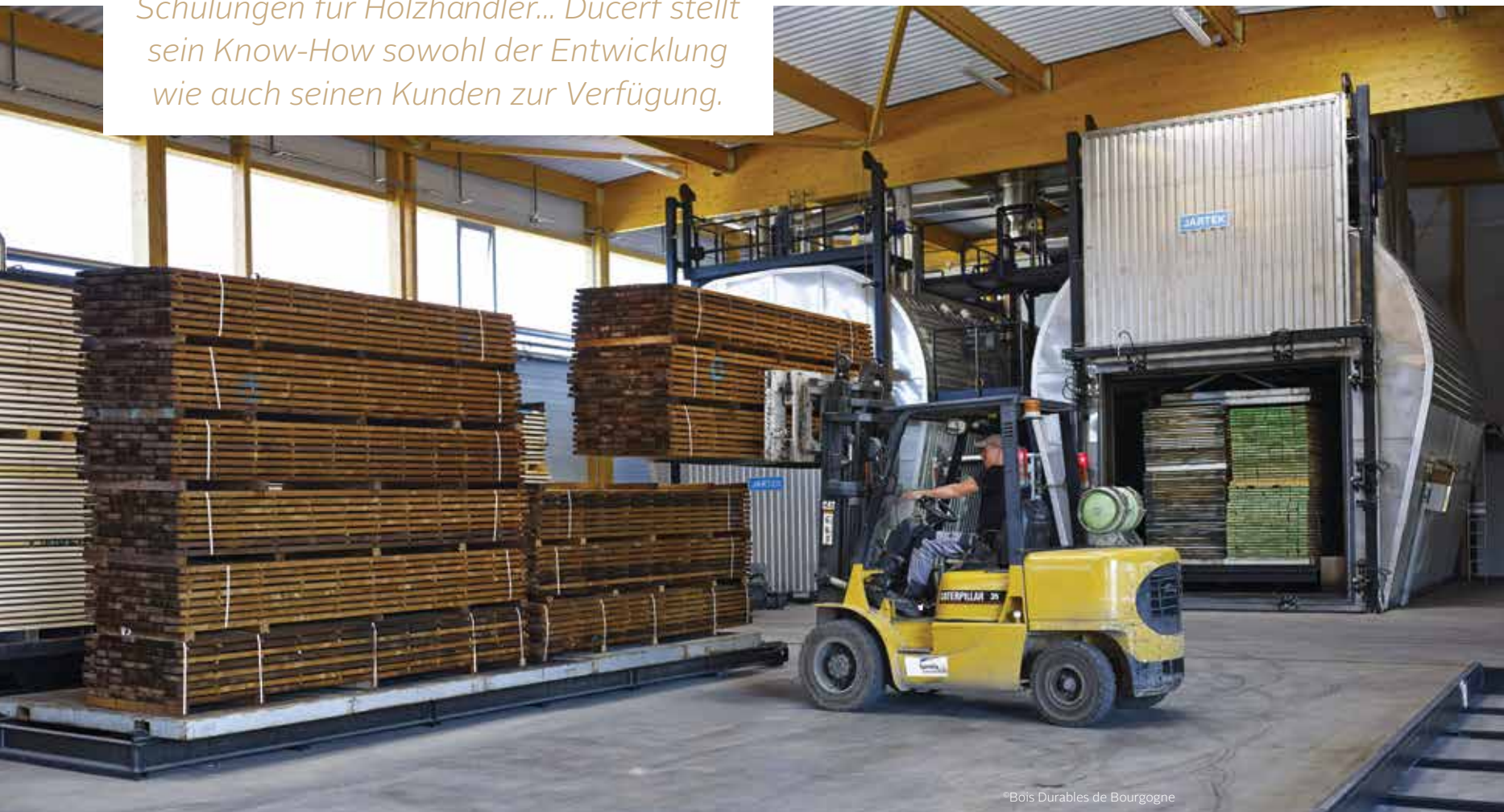
*Bois Durables de Bourgogne

Aus der Erfahrung entsteht Innovation. Neue Lösungen, maßgefertigte Produkte, Schulungen für Holzhändler... Ducerf stellt sein Know-How sowohl der Entwicklung wie auch seinen Kunden zur Verfügung.