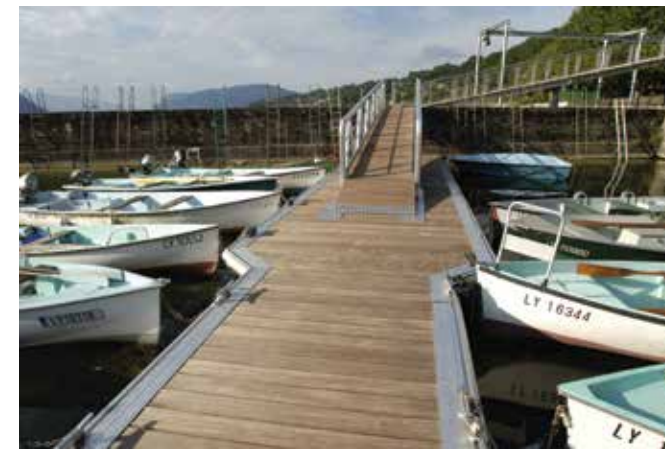
Ponton du Lac du Bourget (73) — Platelage chêne naturel classe 4