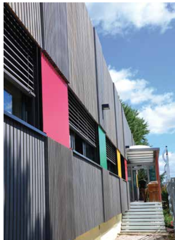
Cetic (71) — Bardage en peuplier THT - Finition Rubio Monocoat® gris vieux bois - Architecte Olivier Le Gallée