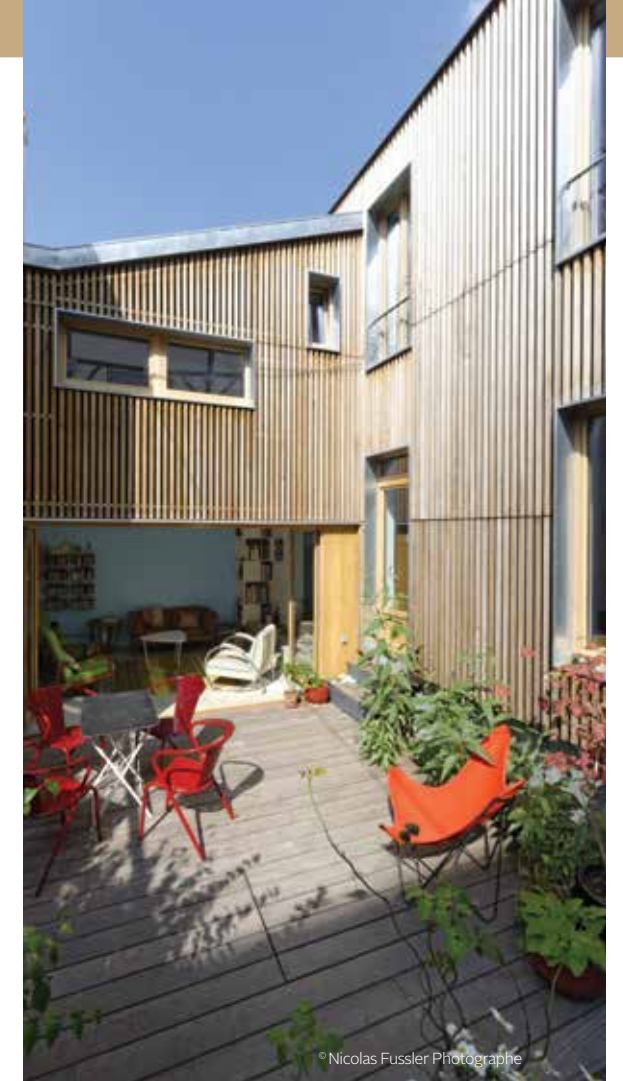
Pré St-Gervais (75) — Bardage en peuplier THT Côtéparc® Verdier-Rebière Architectes