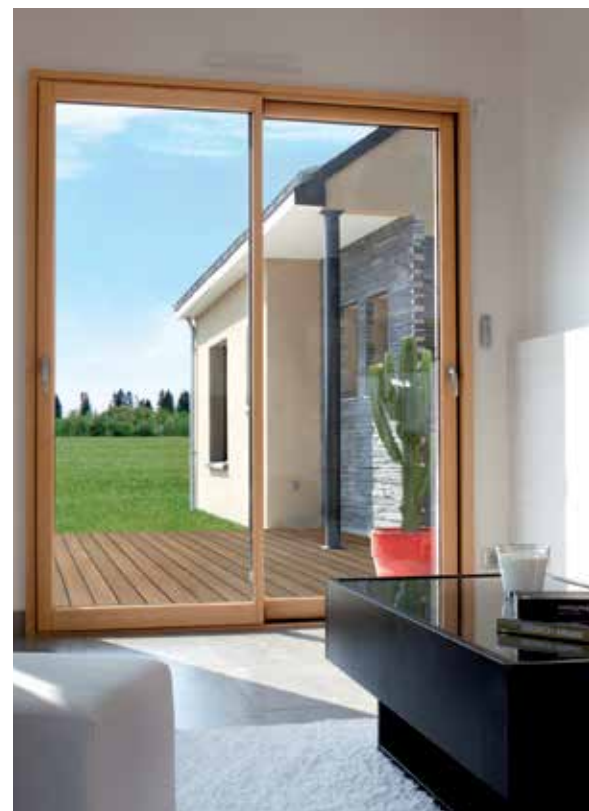
Fenêtre mixte bois-alu : Carrelet chêne Profileo®