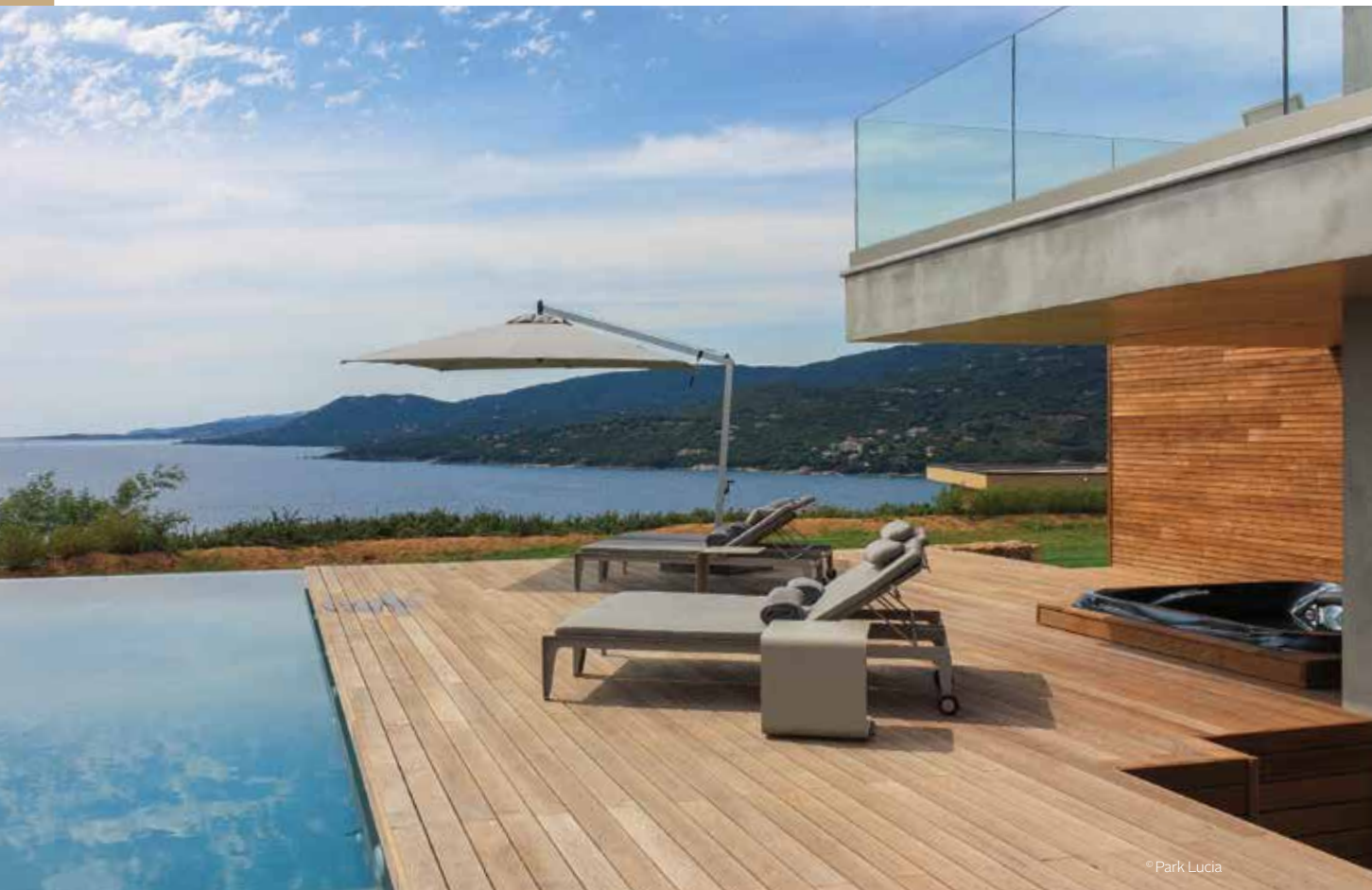
Casa Lucia (20) — Terrasse et bardage en frêne THT Côtéparc®