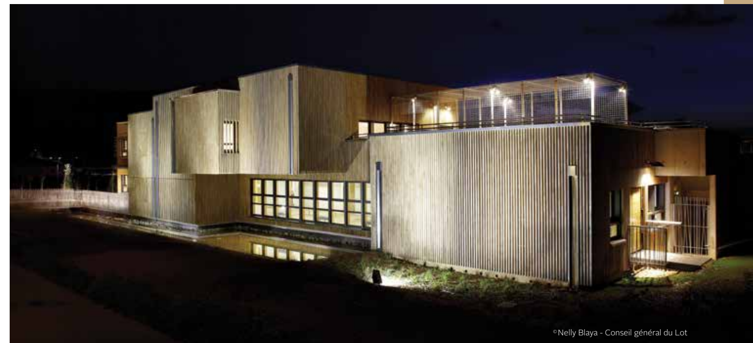
Maison du département du Lot (46) — Bardage en chêne naturel abouté Architecte Philippe Berges